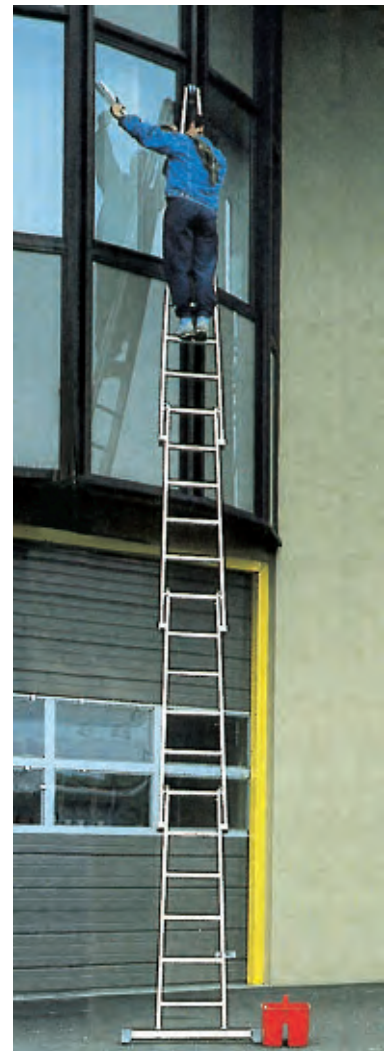
Typ 6311.02, Gr. 23

Fußverlängerung aus Aluminium für Mittelteil und Spitze, stufenlos verstellbar bis max. 0,60 m Best.-Nr. 0600 0500 00 auf Anfrage