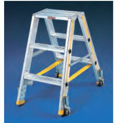
Typ 6567.54 mit Rollen