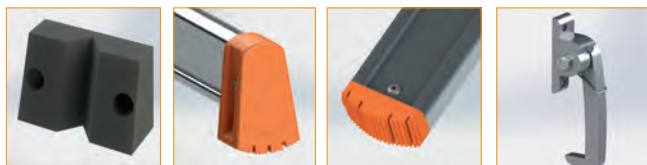
Gummi-Anlegeklotz Traversenschuh Leiterfuß 70 mm Abhebesicherung