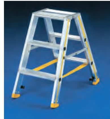
Typ 6567 ohne Rollen